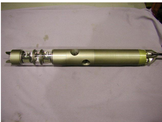
Distribution Pipe Investigation Robot 管内調査ロボット

The features of this robot are as follows: (1) No water suspension is required, (2) Examination in all directions is possible with the front and side cameras, (3) Dimension of crack can be measured, (4) Posture control is easy by using screws and (5) Applicable for large bore diameter pipes thanks to the high-intensity LEDs.