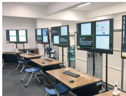
Staff Education and Training System (Risk Management Training) 職員教育訓練システム（危機管理研修）