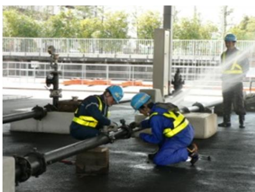
Leakage Prevention Training Area 漏水防止研修等実施エリア