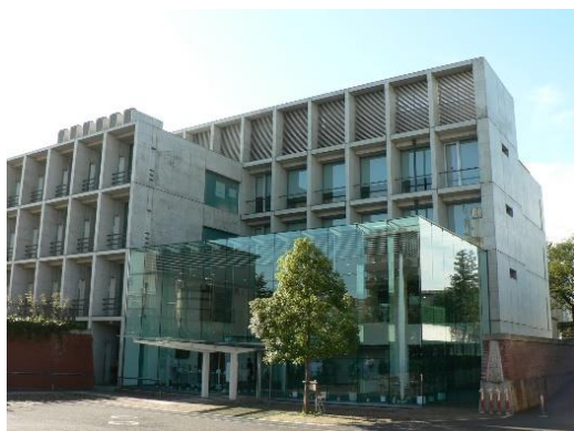
Training and Technical Development Center 研修・開発センター