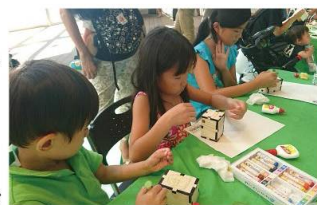
間伐材玩具ワークショップ

当グループが開発・運営する商業施設などにおいて環境イベントを行い、森林・水資源の大切さを伝え、保全活動を啓蒙します。