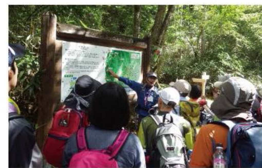
水源林ふれあいウォーク